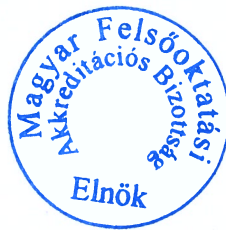
Csépe Valéria a MAB elnöke

Melléklet: a MAB Testület 2021/11/VI/2. sz. határozata és a Testület által elfogadott szakbizottsági indoklás